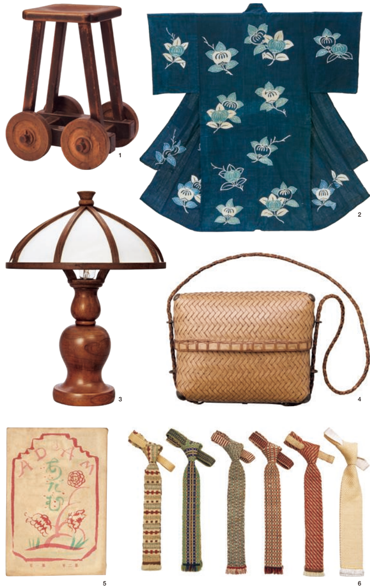
表.《患者用診察椅子》吉田璋也デザイン 1952年 個人蔵 1.《医師用車輪付椅子》吉田璋也デザイン 1952年 個人蔵 2.《木障地間描織文夜着衣》鳥取県 18-19世紀 鳥取民藝美術館蔵 3.《丸傘電気スタンド》虎尾政次、吉田璋也デザイン 1930年代後半 鳥取民藝美術館蔵 4.《竹ショルダーバッグ》吉田璋也デザイン 1950年代前半 個人蔵 5.《雑誌「アダム」第2年 第1号》神沼（武場）隆三郎編、岸田劉生表紙美術、アダム社 1920年2月 鳥取民藝美術館蔵 6.《くにぐりネクタイ》吉田慧代ほか、吉田璋也デザイン 1931年 鳥取民藝美術館蔵 7.《緑袖黒染分皿》牛ノ戸焼、吉田璋也デザイン 1931年 鳥取民藝美術館蔵 8.《北京の天壇》バーナード・リーチ エッチング 1916年 個人蔵 © The Bernard Leach Family. All rights reserved, DACS & JASPAR 2026 E6379

【同時開催】 ルオー・ギャラリーにて、当館所蔵のルオーコレクションの中から作品を展示しております。 【次回予告】 「スウェーデンのうつわ グスタフスペリのある暮らし」2027年1月16日(土)～3月22日(月・祝)